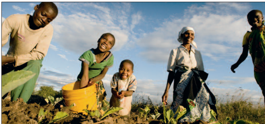
Bestemor Fineli med sine 4 barnebarn

Under her kan du lese en sterk historie om hva pengene vi gir til Kirkens nødhjelp brukes til.